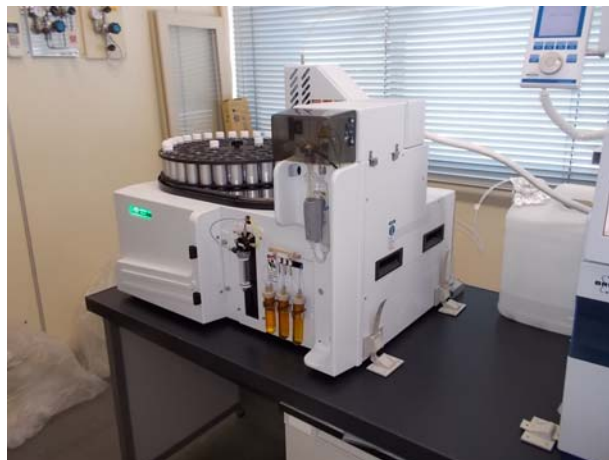
パージトラップ装置部設置状況